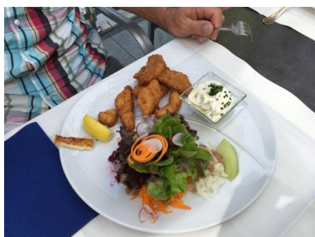
Dessert im Hotel Post Laax Und Diverse Menüs Mittagessen Rebstock Rorschacherberg